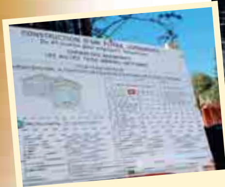
Panneau de chantier de