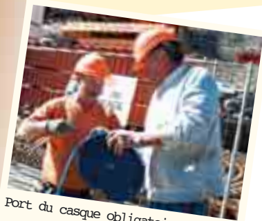
Port du casque obligatoire